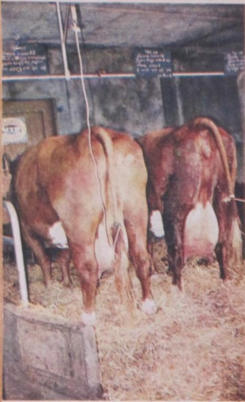
Geesje en Leonora, dochters van Frits van Asinga. Productie van Geesje, oud 7.10 jaar: 5504 kg melk, 4,52 pct. vet, 249 dagen, 4,03 pct. eiwit. Productie van Leonora op 8-jar. leeftijd: 6243 kg melk, 4,64 pct. vet 305 dagen en 3,57 pct. eiwit