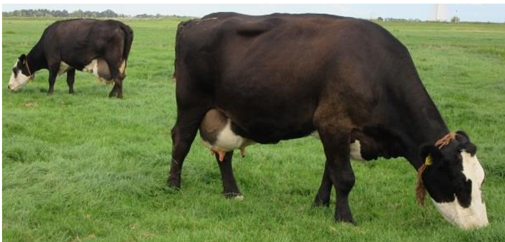
Tetske 153 als 9-jarige (rechts voor) en haar 13-jarige moeder Tetske 122 (links) In de zomer van 2023

Gezondheidsstatus: BVD-vrij / Lepto-vrij / IBR-vrij / Salmonella vrij / Para TBC vrij