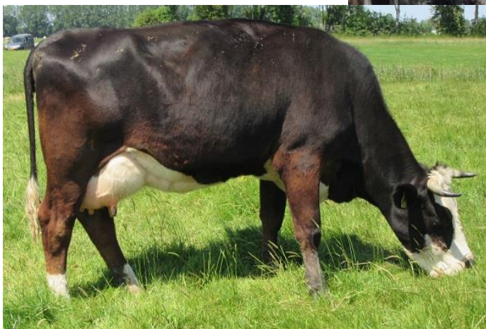
< Olyvia als tweede kalfs koe