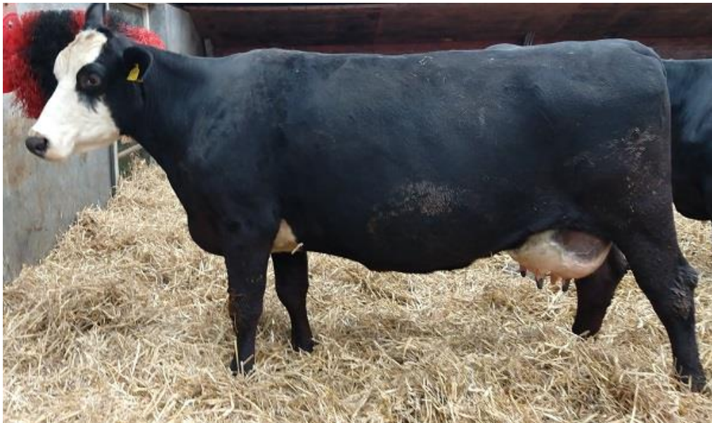
Biene 74 als 11-jarige in april 2023; een heel mooie raskoe met prima uier

Gezondheid: IBR-vrij / Lepto-vrij / BVD-vrij / Para TBC Status A / Salmonella onverdacht