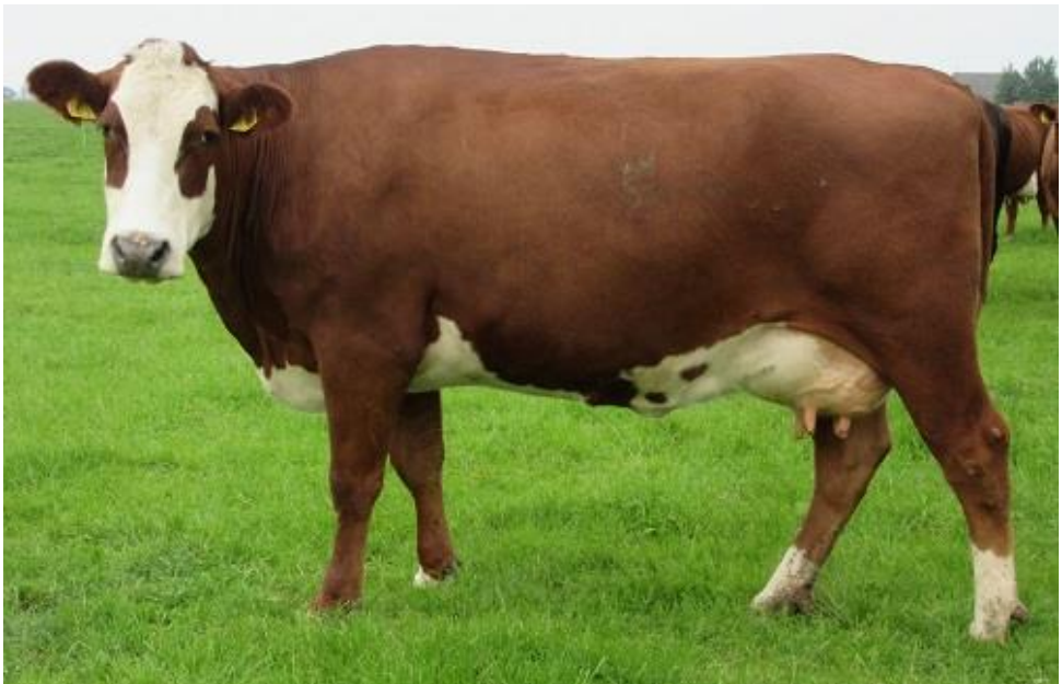
Emmy 107 als 2 e kalfs koe

Gezondheid: IBR-vrij / Lepto-vrij / BVD-vrij / Para TBC Status A / Salmonella onverdacht