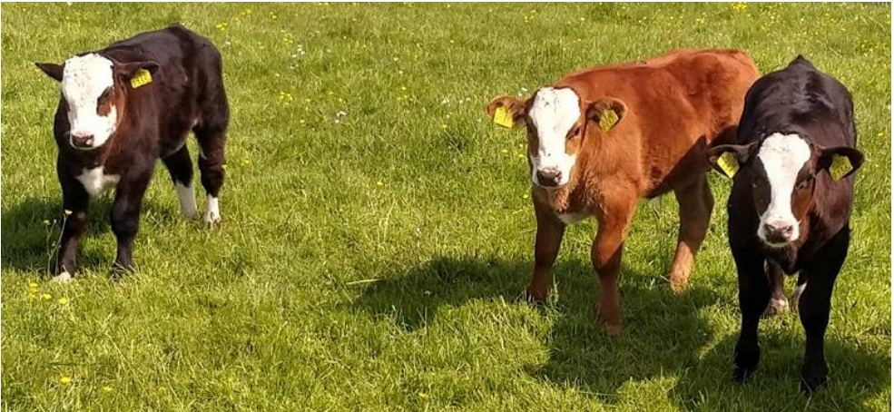
v.l.n.r. 9135, 9137 en 9136 als kalfjes van 1 mnd oud in mei 2023

tel: 06-53950269 e-mail: mtsvanzwieten@hotmail.com