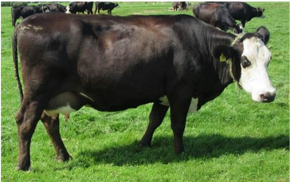
Beatrix 31 in de zomer van 2023

Gezondheidsstatus: BVD-vrij / Lepto-vrij / IBR-vrij / Salmonella vrij / Para TBC vrij