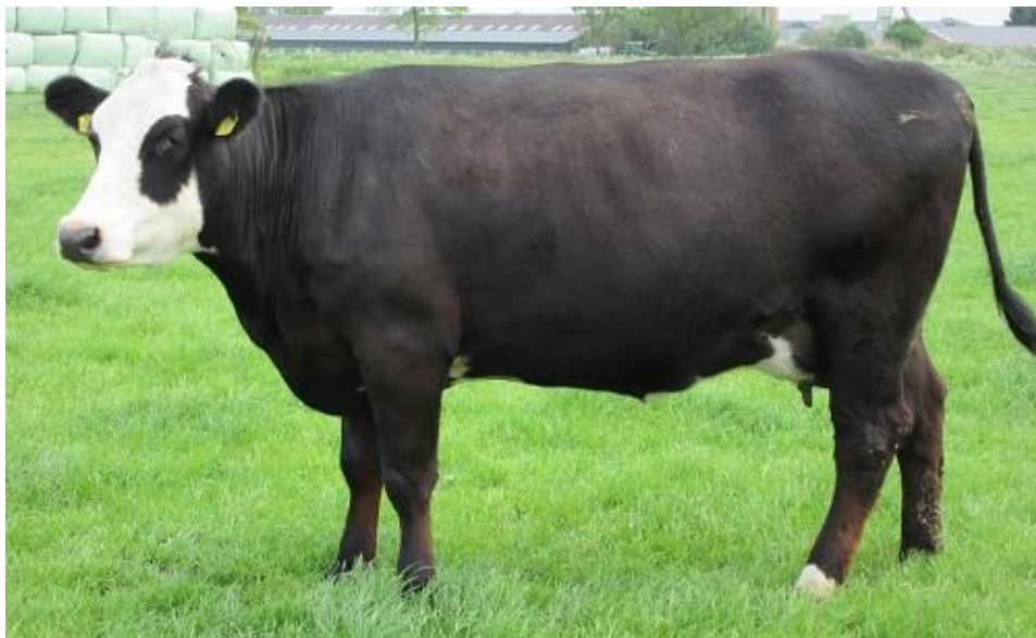
Stiena 187 als jonge koe

Gezondheid: IBR-vrij j / Lepto-vrij / BVD-vrij / Para TBC Status A / Salmonella onverdacht