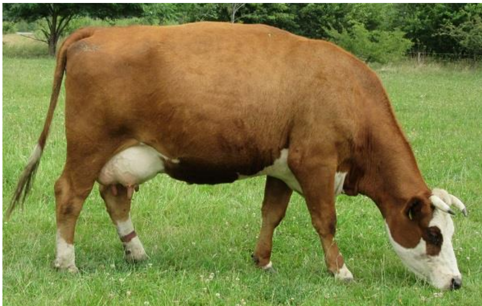
Madeleine in de zomer van 2022 als tweede kalfskoe

Fok-eig: J.Wieringa, Veld&Beek, Fonteinalee 33, 6865 ND Doorwerth, tel: 06-12882815 e-mail: veldenbeek@yahoo.com Gezondheidsstatus: BVD-vrij / Lepto-vrij / IBR-vrij / Salmonella vrij / Para TBC vrij