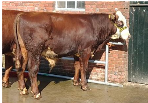
De Graslanden Hidrik >