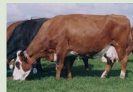
Moeder Bertha 50, als 13-jarige. Levensproductie ruim 80.000 kg melk

Appie van Luxemburg wekt hoge verwachtingen met zijn dochters, waarover de berichten uit de praktijk zeer positief zijn. "Ze lopen er uit" is een opmerking die in dit verband gemaakt is. Appie is een goedgebouwde stier met mooi droog beenwerk. Zijn moeder Bertha 50 is op de foto 13 jaar oud en zoals u ziet nog zeer jeugdig en met een best bewaarde uier. Haar levensproductie is met ruim 80.000 kg en gemiddeld 3,95% eiwit zeer indrukwekkend.