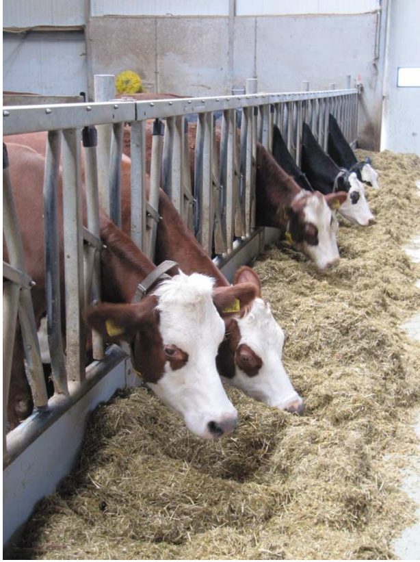
De productieve koeien aan het voerhek