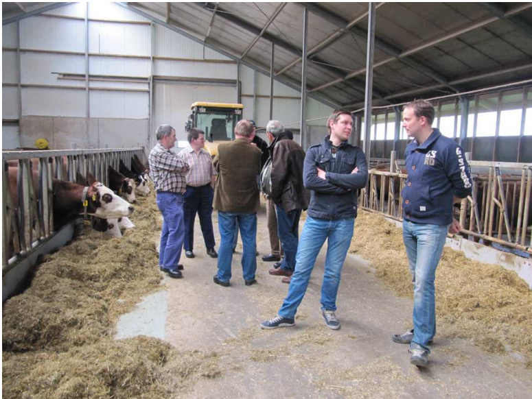
nieuwe contacten en informatie-uitwisseling