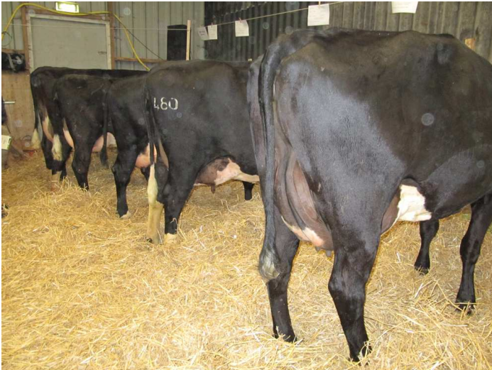
de koeien op stand: rechts vooraan Janke 52, daarachter resp. Roza 457, Janet 11, Corien 69, Juweeltje 2

De groep kreeg veel bejaks en waardering; mooie blaarkoppromotie. Enkele aanwezigen gaven aan volgend jaar ook wel met een blaarkop op de show te willen verschijnen. Het zou mooi zijn als de organisatie van de show de blaarkopveehouders volgend jaar weer ruimte biedt om enkele blaarkoppen te tonen.