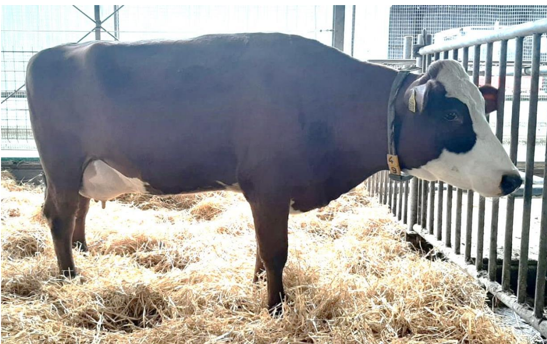
9916 Meintje 94, de prachtige melkvaars die alom hoog gewaardeerd werd (zoals ook te zien is op onderstaand ingevuld formulier naar ontwerp van Theus de Ruig).