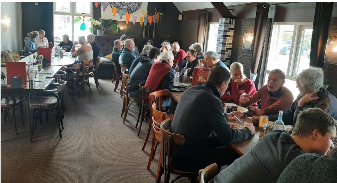
Genieten van een welverdiende en heerlijke lunch. Tijd om nog verder bij te praten en op te warmen