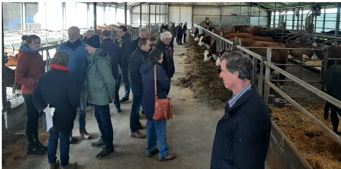
Gezellige drukte in de stal; het kon de koeien niet deren, die trokken zich er niets van aan

Al met al was het een geslaagde dag en was de sfeer weer als vanouds; gemoedelijk en gezellig, en er werd heel wat bijgepraat.